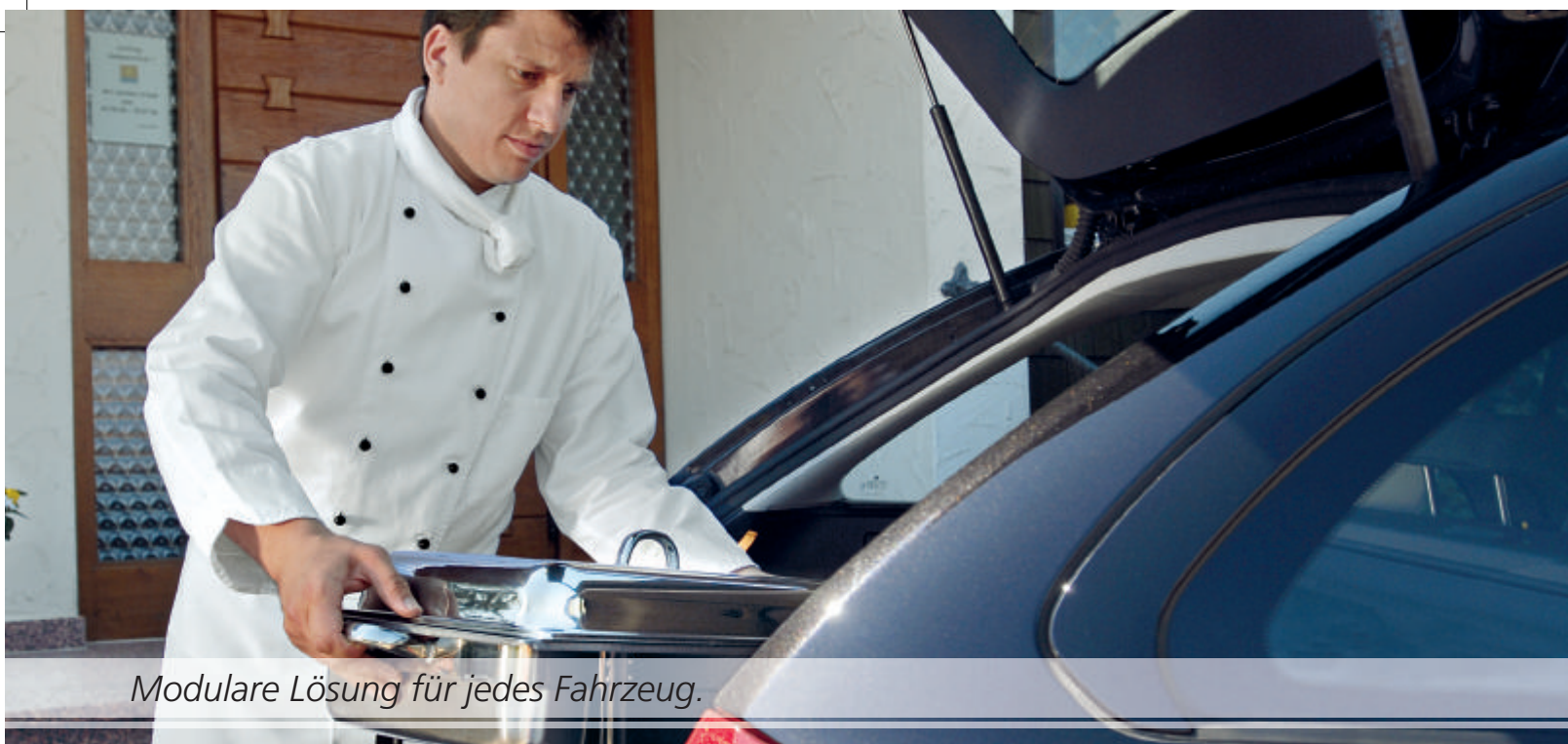
Modulare Lösung für jedes Fahrzeug.

Cargo Systems lässt sich mit wenigen Handgriffen in Ihr Fahrzeug einbauen. Herzstück ist stets die Basisplatte mit integriertem Schienensystem. Welchem Typ in der folgenden Aufstellung entspricht Ihr Fahrzeug? Entscheiden Sie sich für die passende Variante: