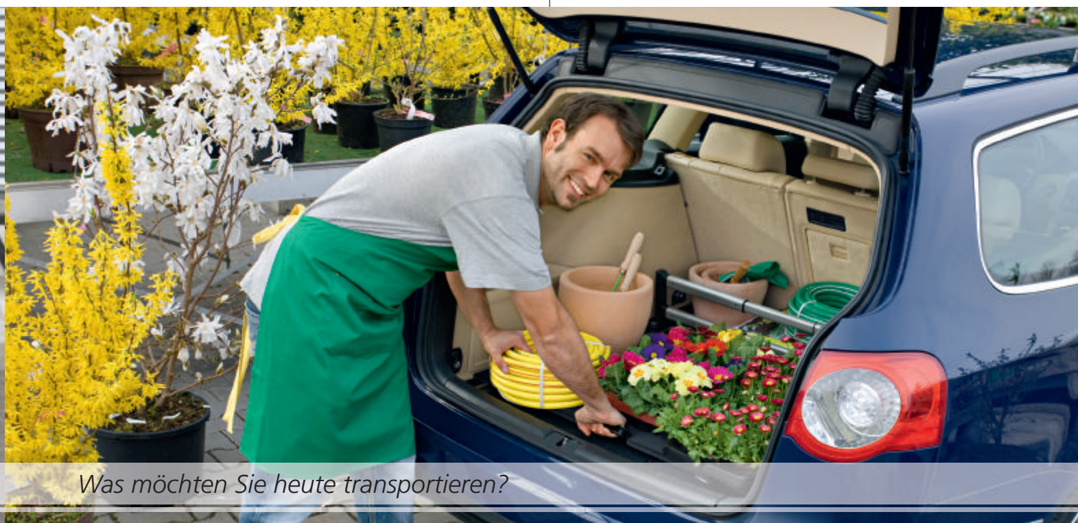
Was möchten Sie heute transportieren?