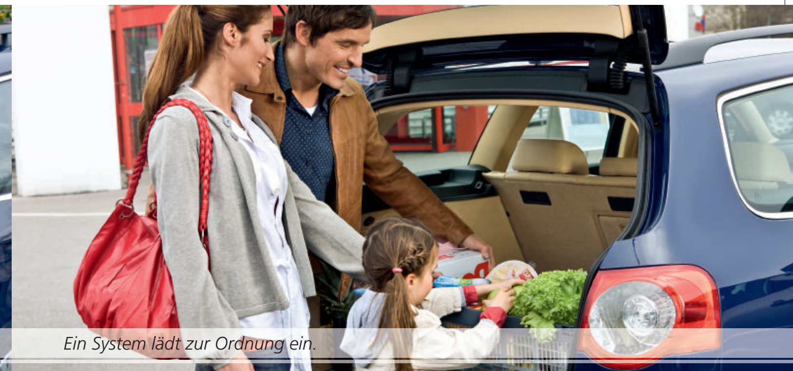
Ein System lädt zur Ordnung ein.

Rufen Sie Ihren Kofferraum zur Ordnung: Mit Cargo Systems, dem modularen Funktionsladesystem von Webasto, hat alles seinen festen Platz. Egal, welches Ladegut Sie transportieren möchten: Das intelligente Schienensystem mit verstellbarem Teleskop-Rahmen, Gepäckgurten und praktischem Zubehör wie der Kunststoff-Klappbox ist die ideale Lösung, um Koffer, Kisten sowie Gepäckteile aller Art sicher zu verstauen.