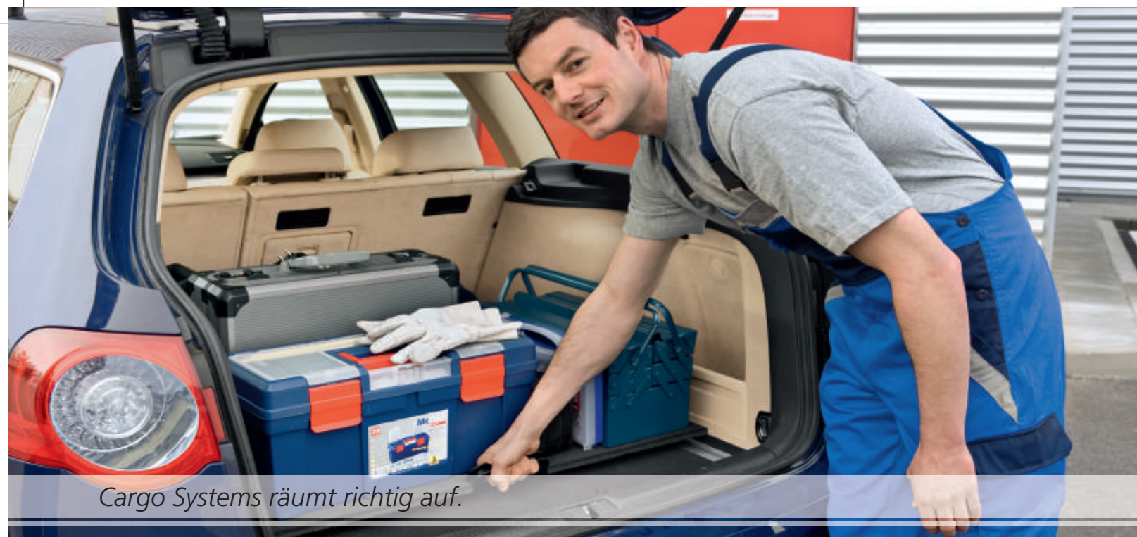
Cargo Systems räumt richtig auf.